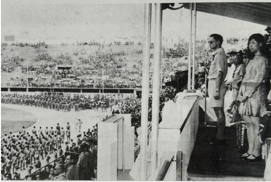
พระบาทสมเด็จพระเจ้าอยู่หัวเสด็จพระราชดำเนินพร้อมด้วย สมเด็จพระเจ้าลูกเธอเจ้าฟ้าอุบลรัตน์ราชกัญญาไปทรงเป็นประธานในพิธีสวนสนาม เนื่องในงานวันคล้ายวันสถาปนาคณะลูกเสือแห่งชาติ ณ สนามศุภชลาศัย กรีฑาสถานแห่งชาติ เมื่อวันที่ 1 กรกฎาคม พ.ศ. 2512