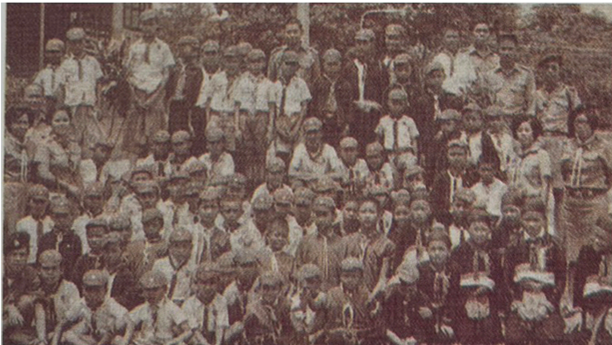
ลูกเสือสำรองชาวเขา โรงเรียนคชด. เข้าร่วมงานวันคล้ายวันสถาปนาคณะลูกเสือแห่งชาติเป็นครั้งแรก ณ สนามสุขุขลาสัย กรีฑาสถานแห่งชาติ เมื่อวันที่ 1 กรกฎาคม พ.ศ. 2510