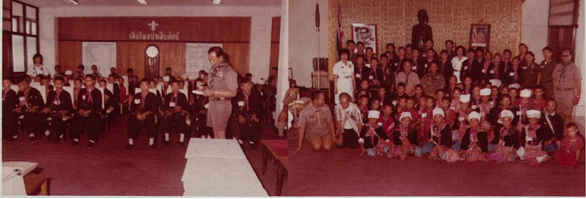
เข้าเยี่ยมชมการระดมคณะกรรมการบริหารลูกเสือแห่งชาติ เมื่อวันที่ 29 มิถุนายน พ.ศ. 2527