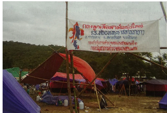
กองลูกเสือสามัญรุ่นใหญ่ โรงเรียนมัธยมพระราชทานนายว ต.ท่ากระดาน อ.สนามชัยเขต จ.ฉะเชิงเทรา ณ ค่ายลูกเสืออชิราวุธ ถนนสุขุมวิท ต.บางพระ อ.ศรีราชา จ.ชลบุรี เมื่อวันที่ 6 มกราคม พ.ศ. 2547