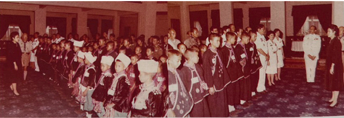
เข้าเฝ้าฯ สมเด็จพระเทพรัตนราชสุดาฯ สยามบรมราชกุมารี ณ ศาลาดุสิดาลัย เมื่อวันที่ 2 กรกฎาคม พ.ศ. 2527