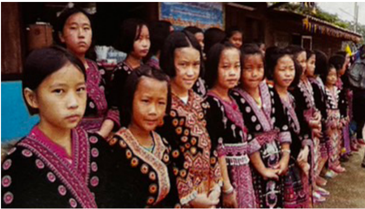
โรงเรียนเจ้าแม่หลวงอุปถัมภ์ 2 ต.โป่งแยง อ.แมริม จ.เชียงใหม่