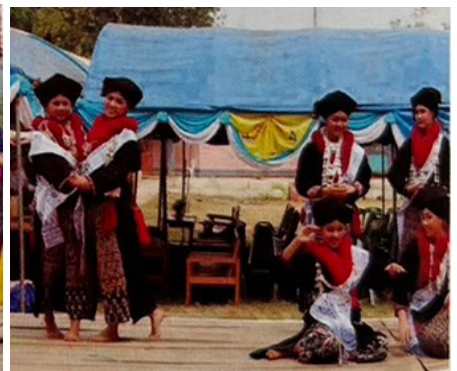
โรงเรียนเจ้าแม่หลวงอุปถัมภ์ ๑ ต.แม่ฮ่อง อ.ฝาง จ.เชียงใหม่